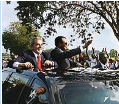
Lula desfila nas ruas de Brazzaville, capital do Congo: os eleitores fiéis ao presidente podem decidir as eleições de 2010

As primeiras sondagens sobre as eleições presidenciais de 2010 mostram que, se nada de extraordinário ocorrer até lá, o presidente Luiz Inácio Lula da Silva exercerá um papel importante na própria sucessão. Personagem principal das últimas cinco eleições, ele não estará entre os candidatos. Em entrevistas recentes, Lula disse que pretende se empenhar na campanha de seu sucessor usando, para isso, um capital hoje muito expressivo: sua popularidade. Uma pesquisa divulgada na semana passada pelo instituto Sensus mostra que o presidente é um cabo eleitoral poderoso. Somente 27% dos entrevistados disseram que não votariam em um candidato apoiado por Lula. O restante admite a possibilidade de seguir a orientação do presidente. Isso, porém, não quer dizer que o escolhido por Lula possa começar a pensar na faixa presidencial. De acordo com a pesquisa, 10% votariam cegamente no sucessor indicado por Lula, independentemente de quem seja, 25% admitem a possibilidade e 32% tomariam a decisão apenas depois de conhecer o candidato. Ou seja: o fato de o presidente ser popular não significa necessariamente que ele consiga – ou queira – transferir esse patrimônio para um aliado. Essa será a principal incógnita dos próximos três anos.